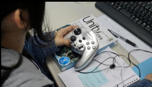
コントローラーでの使用感を確認