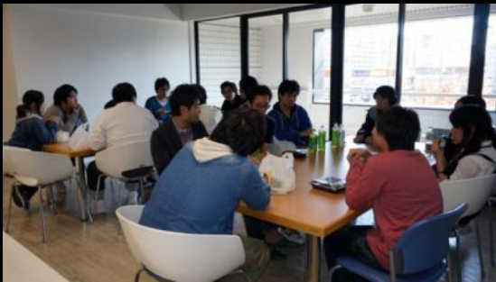
時間の節約でランチミーティング

さらに結束力は高まっていき、「絶対に完成させるぞ！」という高揚感もどんどん向上し、時間を惜しまずに制作を続けていた