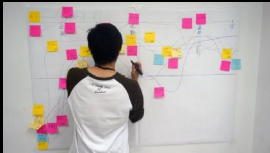
モチベーショングラフを作成