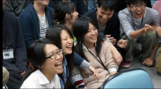
他チームの発表に思わず笑みも