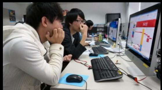
最後のスケジュール確認は明日に生きる