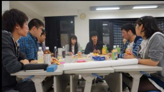
BNS スタッフとの最後のコミュニケーション 貴重なお話を沢山聞くことができました