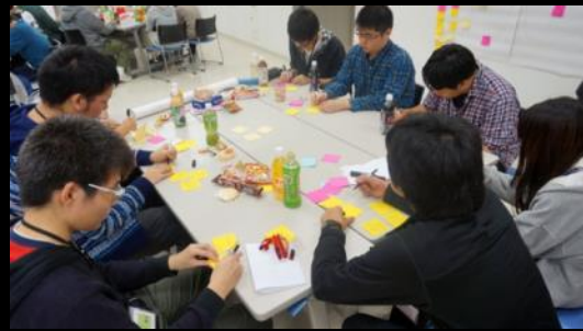
良かったこと悪かったことを話し合う