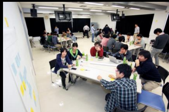
模造紙を使いアイデアを整理していく