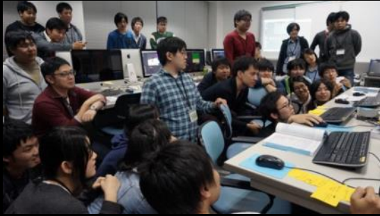
制作した PC の前に集まり真剣に発表を聞く