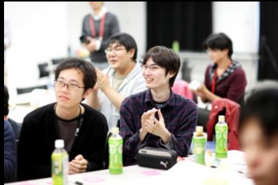
面白いアイデアが出ると、他チームから拍手も