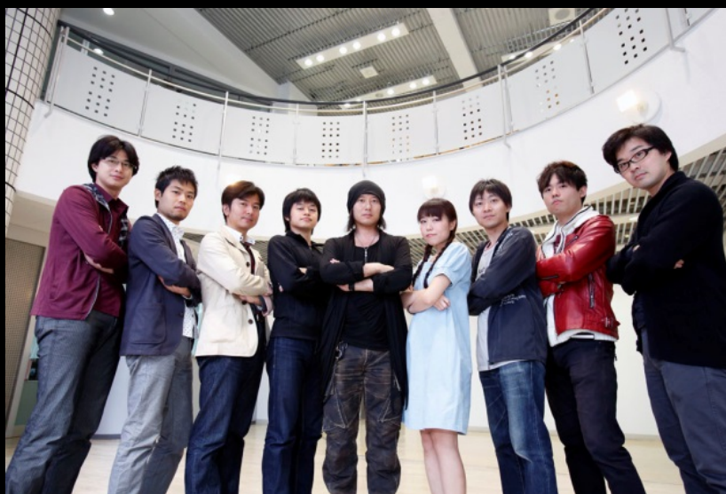
バンダイナムコスタジオから総勢9名の参加

2014年10月11日（土）、12日（日）の二日間で、株式会社バンダイナムコスタジオ（以下、BNS）の第一線で活躍しているクリエイター9名と、吉田学園情報ビジネス専門学校（以下、本校）ゲーム学科II年生30名が5チーム構成となり、「15時間」という短時間でゲーム開発を行う「GameJam」が開催された。