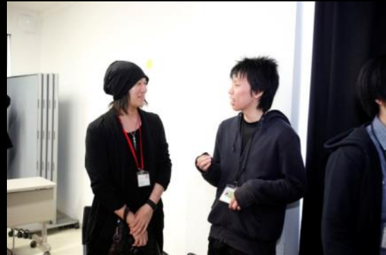
アイスブレイクでコミュニケーションを図る