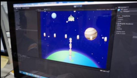
試作できる段階のチームもある