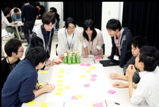
付箋にアイデアを書き出す

アイデアをみんなで出し合い、整理していく。これをランチタイムもミーティング形式で話し合いを行い、更にコミュニケーションと企画力を高めていくことになる。