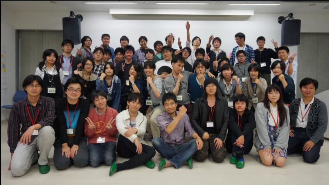
BNS9 名（前列）と本校学生達