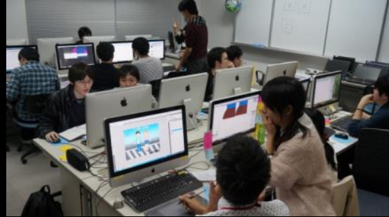
最後の追い込みです