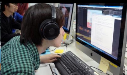
いよいよサウンドにも着手