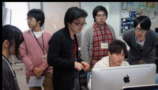
各々の役割を詳細に確認していく