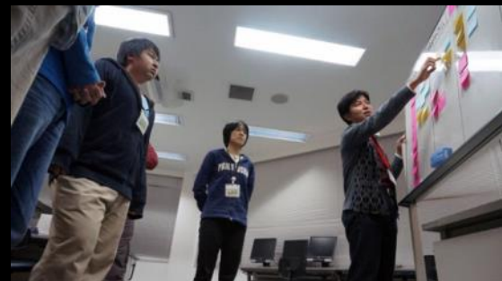
発表会後に自分達のチームの振り返り