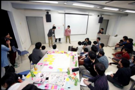
2分間の短時間で発表

かなり興味深いゲーム企画も飛び出し、さて完成までにどのようになっているのか・・・。