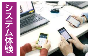
システム体験 スマホプログラム