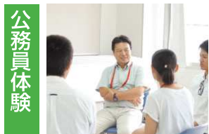
公務員体験 OBとの座談会&模擬授業