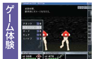
ゲーム体験 ロールプレイングゲーム制作