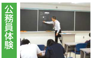
公務員体験 OBとの座談会&模擬授業