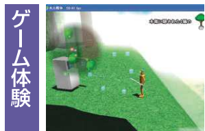
ゲーム体験 アクションゲーム制作