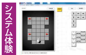
システム体験 ロボットへ命令!アルゴリズム!